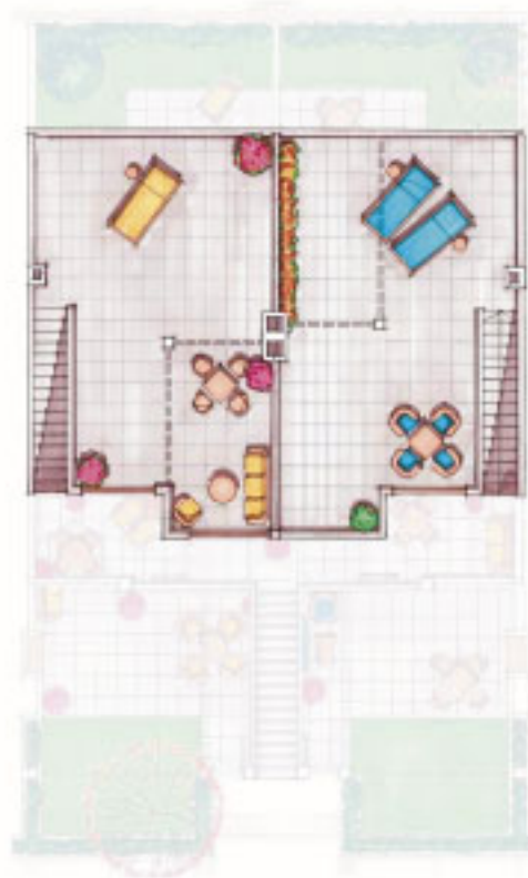
PLANTA ÁTICO / SOLÁRIUM