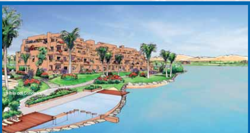
ADVERTENCIA: REPRESENTACIÓN CONCEPTUAL, PRELIMINAR Y NO DEFINITIVA DEL PROYECTO. LA APARIENCIA, DISEÑO Y VOLUMEN REFLEJADOS SON ORIENTATIVOS Y NO SON VINCULANTES.

Imagine levantarse con los primeros rayos de sol, desayunar mientras observa la serenidad de la naturaleza, sentir el frescor de la inmensidad del lago y, por supuesto, admirar el impresionante aspecto de los campos de golf... Sensaciones de bienestar y tranquilidad difícilmente igualables que configuran a los apartamentos de La Isla del Condado Golf Resort como la opción más cercana a una vida paradisíaca.